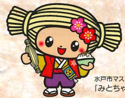
水戸市マスコットキャラクター 「みとちゃん」